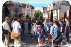
▲青少年友好親善使節団