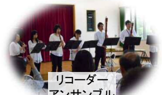
リコーダーアンサンブル