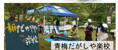
青梅だがしや楽校