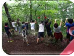
▲青梅子ども体験塾