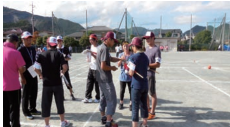
△運動会を進行する体育担当