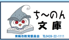
ち〜のん文庫 青梅市教育委員会 TEL.0428-22-1111

し、家に持ち帰って読むこともできます。ぜひご利用ください。 読み終えた本は必ずお返しください。 開設場所 市役所1階議会情報コーナー 開設時間 午前8時30分～午後5時 ※木曜日は午後8時まで ※土・日曜日、祝日、年末年始は利用できません。 問い合わせ 社会教育課 図書館担当