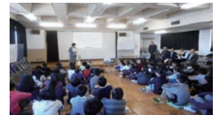
△四小での出前授業

つたない実践ではありますが、地域のおじさんたちから子どもたちへ、ふるさとを学ぶ機会を与えることができたこと、また、自分たちの住んでいる地域を熱く語る事ができたことが、大変うれしかったです。