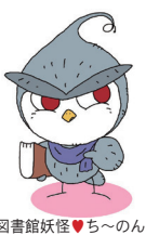
図書館妖怪ち〜のん

▽中学生になったら何読む? ティーンズコーナーからオススメ本を紹介 ▽読書手帳コーナー