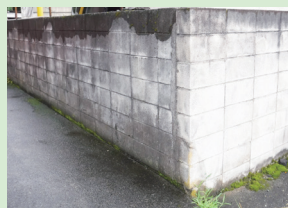
△コンクリートブロック塀

補助額 次のいずれかのうち最も少ない額(1千円未満の端数切り捨て) ▽工事に要した費用の10分の9の額 ▽撤去するブロック塀等の長さ1m当たり6千円を乗じて得た額 ▽18万円 その他 申請要件や申請方法等の詳細は、市役所1階総合案内、防災課(市役所5階)、各市民センター、中央図書館で配布している案内または市ホームページ(申請書のダウンロード可)をご覧ください。