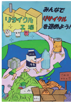
小学6年生の部金賞