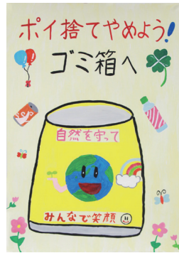
小学5年生の部金賞