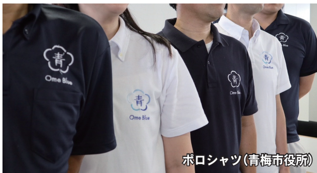
ポロシャツ(青梅市役所)