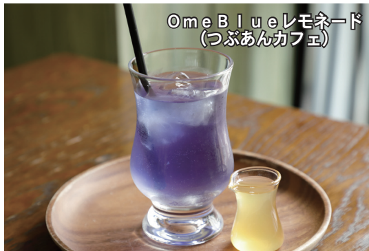
OmeBlueレモネード (つぶあんカフェ)