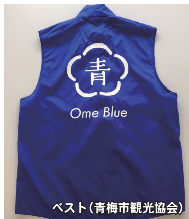
ベスト(青梅市観光協会)