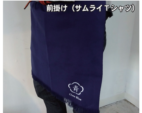
前掛け(サムライTシャツ)