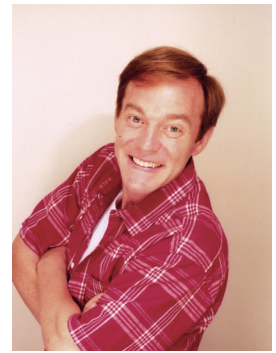
ダニエル・カール氏

プロフィール 翻訳家、タレント、山形弁研究者。米国カルフォルニア州出身。高校・大学時代に留学生として来日。卒業後、英語指導主事助手として山形県に赴任し、3年間従事。その後、翻訳・通訳会社を設立。山形弁を武器に、バイタリティあふれる行動力とユーモア豊かなサービス精神で、ドラマ、コメンテーター等幅広く活躍中。