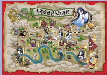
青梅妖怪伝説絵図