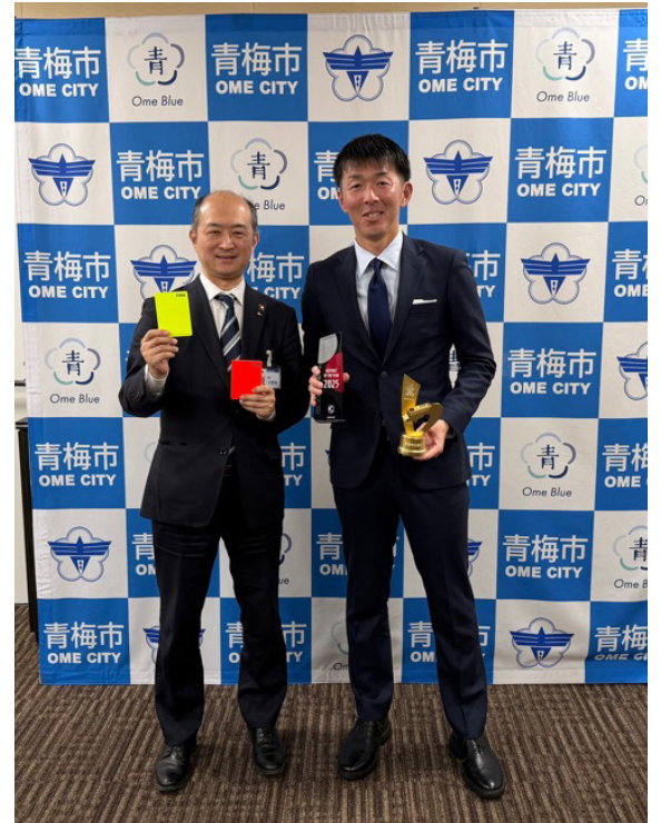
Jリーグ最優秀主審賞受賞後の表敬訪問で

もちろん今回の大会も全力で頑張りますが、次の大会も見据えてやっていくという気持ちで臨みたいと思います。