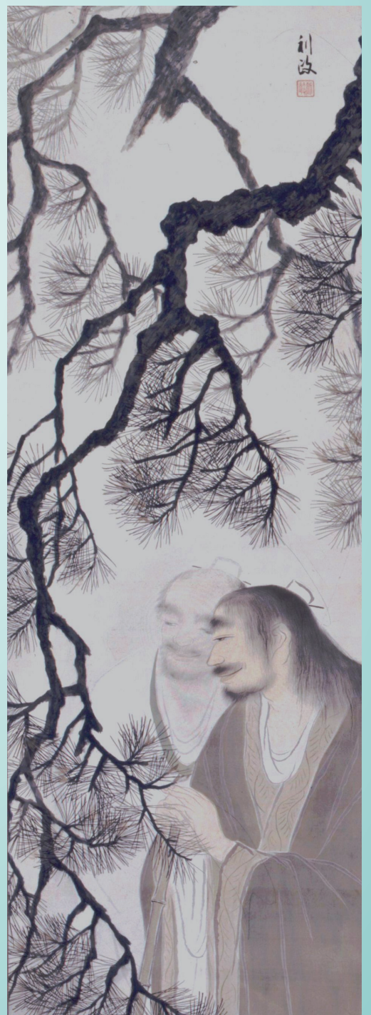
《寒山拾得》絹本着色、制作年不明