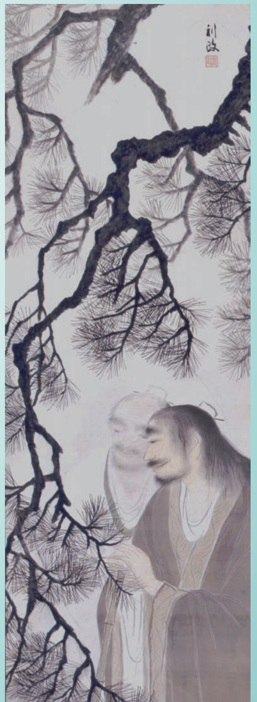
《寒山拾得》絹本着色、制作年不明