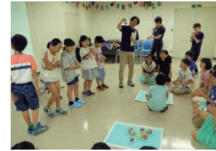
▲各国のコマ遊び体験の様子

外国人講師による英会話、海外で活躍する方や日本文化の専門家などを招いて学ぶ文化講座（小学4年生を除く）を中心に、自由参加の特別講座やスタディツアーも行います！ 日程 5月19日（平成31年3月2日の土曜日（原則第1・4土曜日）） 会場 市役所2階会議室、福祉センター ほか 対象・定員・時間 市内在住・在学の児童・生徒（下表参照）