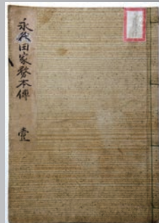
△永久田家務本傳(一)原本

郷土博物館では、江戸時代の文人・山田早苗が書き記した貴重な記録である「永久田家務本傳」を翻刻し、青梅市史史料集第五十七号として発刊します。