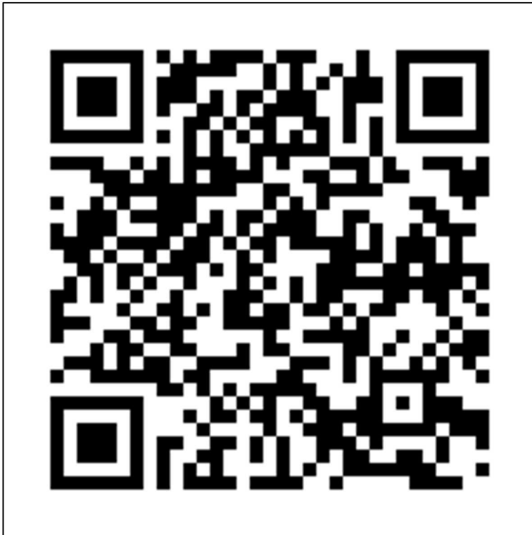
募集ホームページ(青梅市)