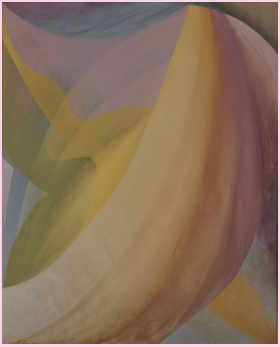
江見絹子「ベガサスのいる空」 油彩/カンヴァス、1991年