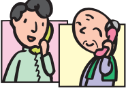
民生委員・児童委員(○は主任児童委員)(敬称略)

職務上知り得た個人情報については守秘義務が課せられておりますので安心してご相談ください。