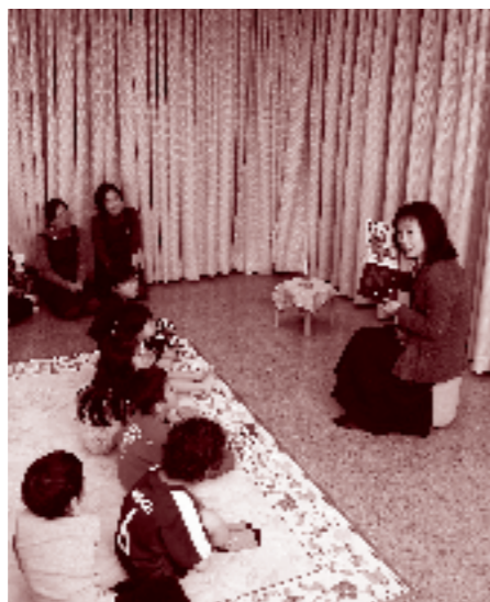
中央図書館おはなし会

さらに、中央図書館と分館との役割を明確化し一体的な運用を図るとともに、特色のある図書館づくりを推進します。