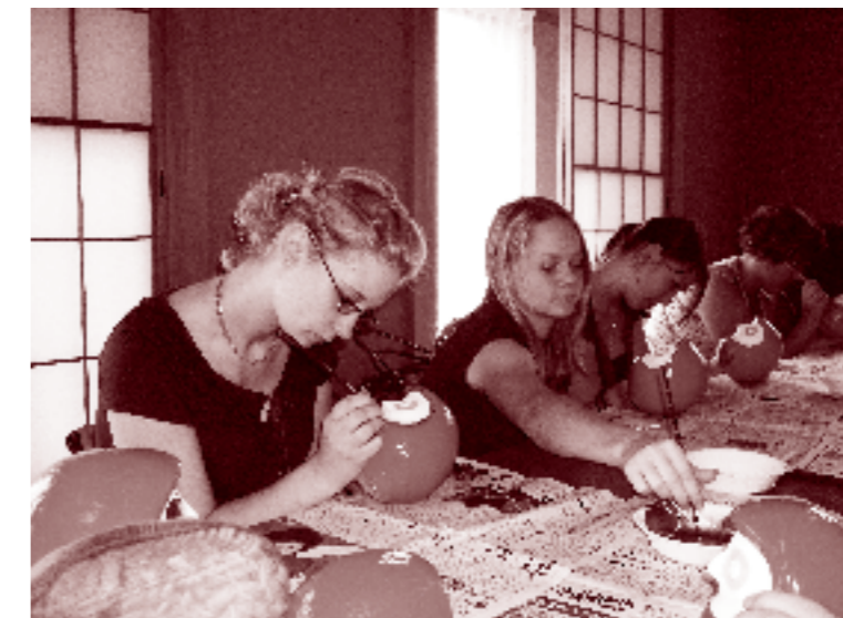
ポッパルト市青少年友好親善使節団

さらに、杉並区と交流のある自治体との交流や多摩川流域の地域間交流の検討など新たな自治体との交流を推進し、スポーツ、文化、イベントなど様々な機会を通じて交流の輪を広げ、災害時には相互に援助し、自治体間だけではなく市民同士の心がつながり合える交流を目指します。