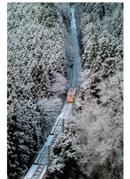
雪のケーブルカー