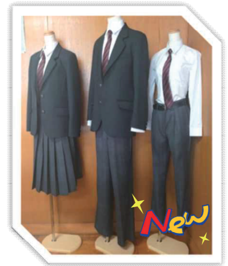
▲新しく導入された「生徒が選択できる制服」

生徒からは、「以前の制服よりも機能性が上がって動きやすい！」と声があがっているそうです。この制服が選択できることに対する混乱などは、アンケートの段階から特になく、生徒や保護者に受け入れられています。