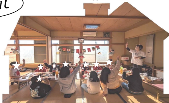
対象：小学生、中学生、高校生