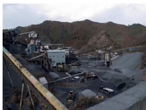
市内採石場の様子