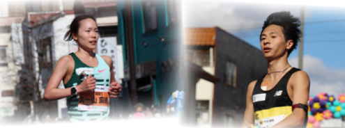
△パリオリンピック内定 一山麻緒選手