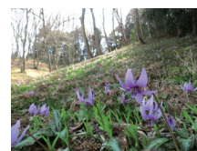
△天祖神社のカタクリ群生地