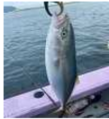
写真：相模湾のいなだ

日本で最初の給食は「おすび・塩ざけ・漬物」の3品だったとされています。今の給食とは少し違ってきますね。