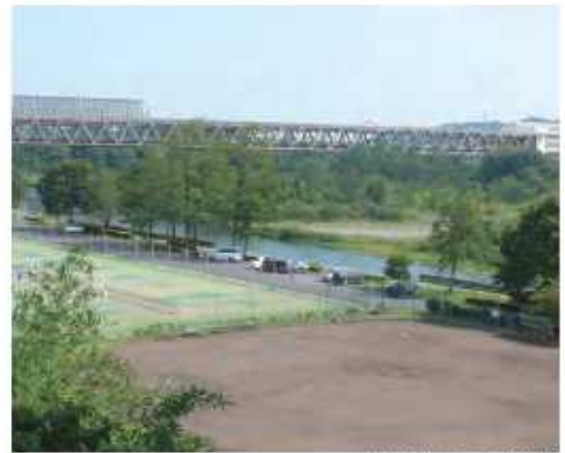
河川敷の市民球技場

多摩川沿い市街地については、多摩川の自然環境や景観との調和を図るため、建築物の高さの最高限度が定められていない地区についての、適正な高さの制限を検討します。