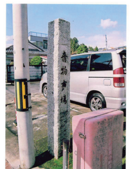
かつての青物市場の石柱(平成23年撮影)▷

戦時中、「青物市場」は閉鎖され、昭和27(1952)年に「青梅青果市場」として同じ場所に再開しました。その後、昭和48(1973)年に藤橋地区に移り、青梅・福生・川越などを含め西多摩の台所として活況を呈しましたが、大型スーパーの進出や後継者不足による小売業者の減少により、惜しまれながらも令和5年5月30日に閉鎖されました。