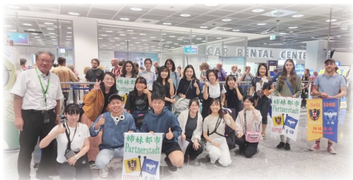
△フランクフルト空港にて