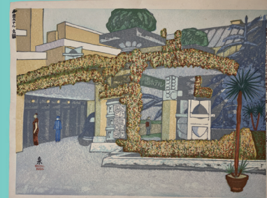
《帝国ホテル玄関》木版/紙 1936年 昭和館蔵