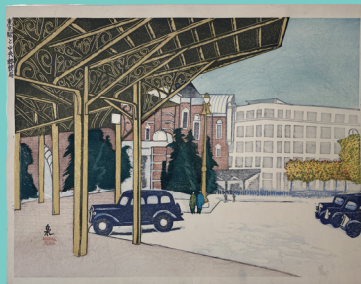
《東京駅と中央郵便局》木版/紙 1936年 昭和館蔵