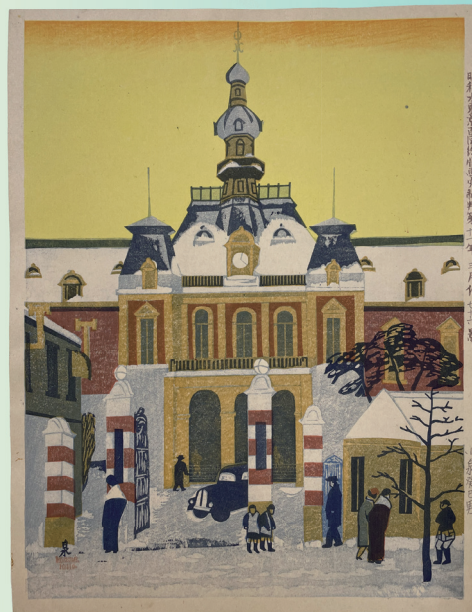
《東京市役所》木版/紙 1936年 昭和館蔵