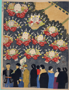
《浅草・西の市(改版)》木版/紙 1940年 昭和館蔵