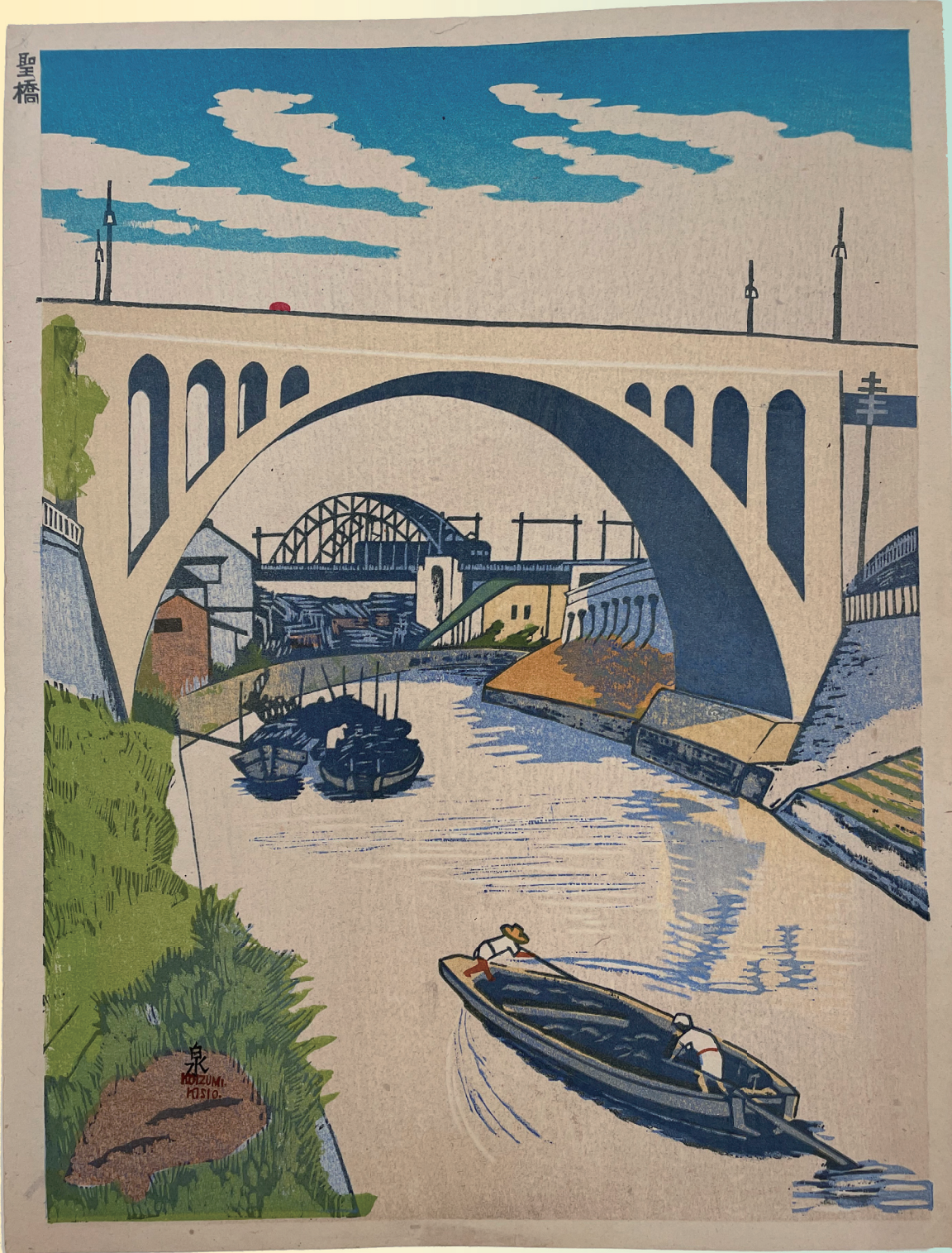
《聖橋》木版/紙 1932年 昭和館蔵