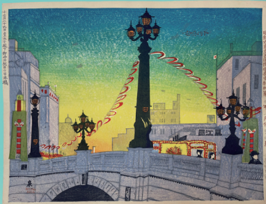
《十二月二十九日皇太子殿下御名祝日の日本橋》 木版/紙 1934年