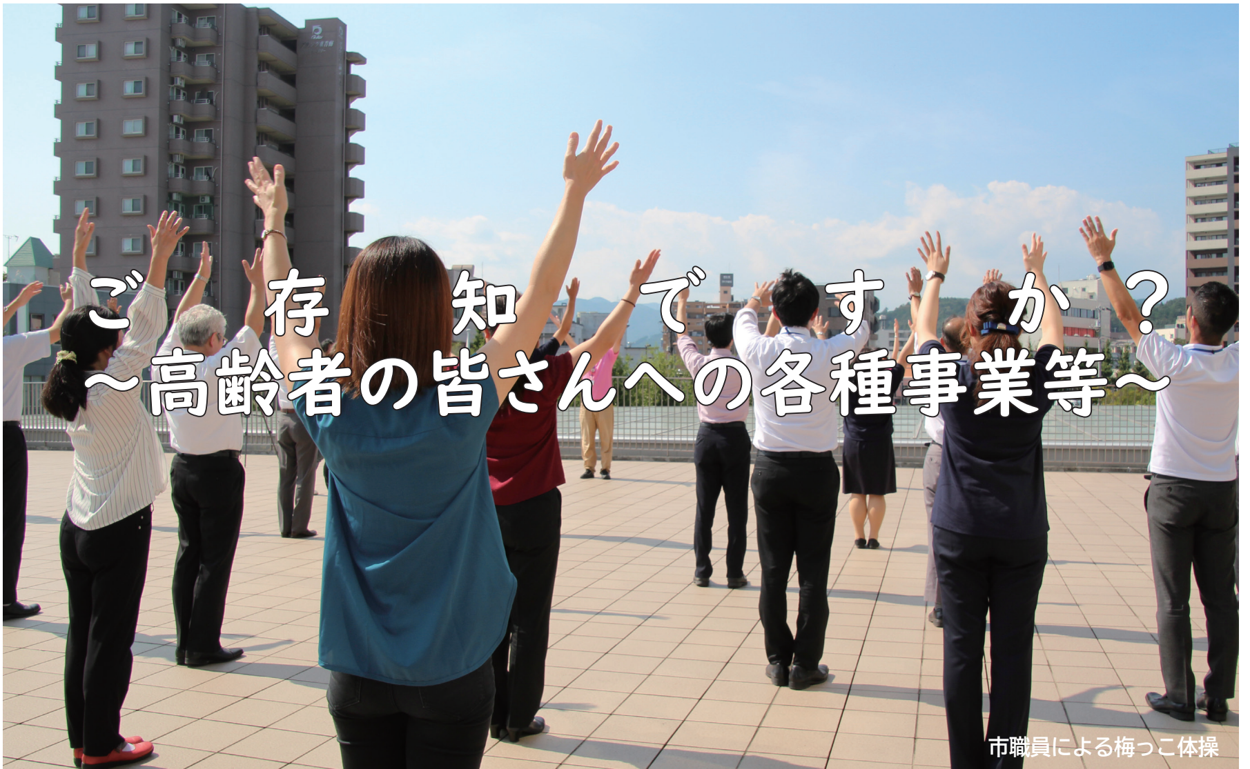
市職員による梅っこ体操

【普通话】青梅市政府网页还提供以上语言：英语、普通话、广东话、韩语、西班牙语和德语。 【普通话】青梅市政府网页还提供以上语言：英语、普通话、粤语、韩语、西班牙语和德语。 【한국어】저희 오우메시 홈페이지는 영어, 중국어, 광둥어, 한국어, 스페인어, 독일어도 볼 수 있습니다. 【Deutsch】Die Website der Stadtregierung Ome ist auch erhältlich in: Englisch, Mandarin, Kantonesisch, Koreanisch, Spanisch und Deutsch.