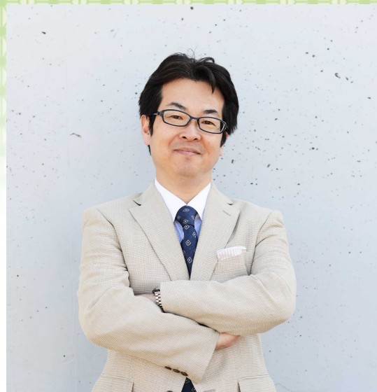
講師：河合 敦 先生（歴史作家）

「歴史探偵」（NHK）、「世界一受けたい授業」（日本テレビ）、など多数。NHK時代劇の時代考証も多く手がける。