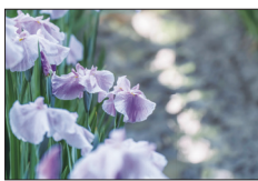
△昨年度の入賞作品