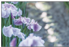
△昨年度の入賞作品