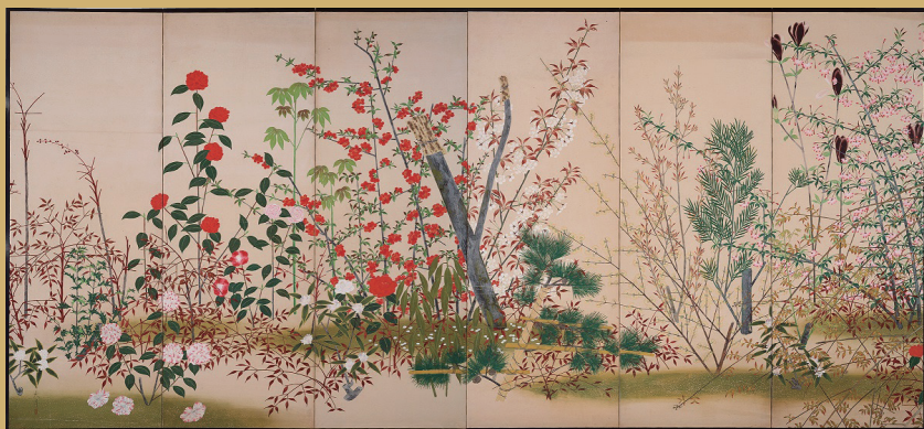
小山大月<苗園(春苑)>>紙本着色 六曲一隻屏風 1931年

「風を屏障 へいしょう 」するものを意味する屏風の起源は、中国古代にさかのぼります。風や人目を遮るための実用的な調度として制作と使用が始まりましたが、日本においては平安時代に芸術的方向に大いに発展し、大画面絵画を制作する際の表現形式として定着しました。