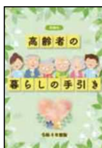
▲「高齢者の暮らしの手引き」(市HP記事ID:2090)

認知症は早期に治療することで、進行を穏やかにすることができます。まずは、かかりつけ医やもの忘れ相談医、認知症サポート医に相談しましょう。詳しくはパンフレット「高齢者の暮らしの手引き」「もの忘れかな? 認知症かな?」をご覧ください。冊子は市役所・地域包括支援センターで配布しています。