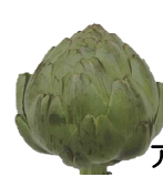
アーティチョーク