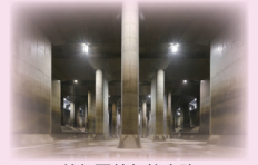
首都圏外郭放水路