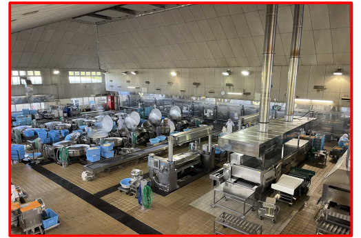
給食センターの調理風景

がっこうきゅうしょく めいじ ねん やまがたけんつるおかまち げんざい つるおかし 学校給食は、明治22年、山形県鶴岡町（現在の鶴岡市） の小学校で始まりました。当時、貧しい家庭の子供たちに、 おにぎり・塩鮭・漬物を無償で提供したのが始まりです。