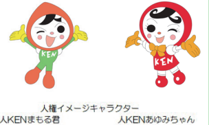
人権イメージキャラクター 人KENまもる君 人KENあひみちゃん