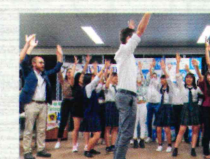
ボツパルト市からの使節団との交流会