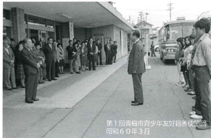
第1回青梅市青少年友好親善使節団 昭和60年3月

この姉妹都市交流のあゆみは、 両市民が積極的に「交流活動」に参加することで、 支えられてきました。