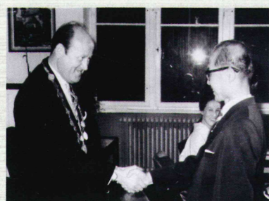
姉妹都市提携盟約式

1965年（昭和40年）9月24日、ドイツ・ボツパルト市で 都市提携盟約式典が挙行されました。両市長により、姉妹都市提携の 盟約書への署名が行われ、今日まで続く姉妹都市交流が開始しました。