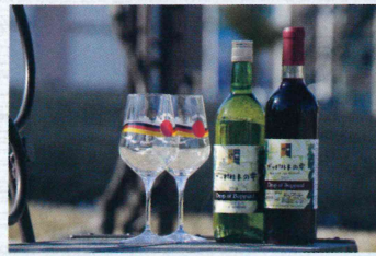
ワイン「ボッパルトの雫」

「友好の鐘」は、姉妹都市交流50周年を記念し、両市に同じ型で作られたものが設置されています。 青梅市では、市役所の前庭に設置し、多くの市民に愛されています。