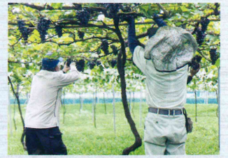
福祉農園での栽培の様子