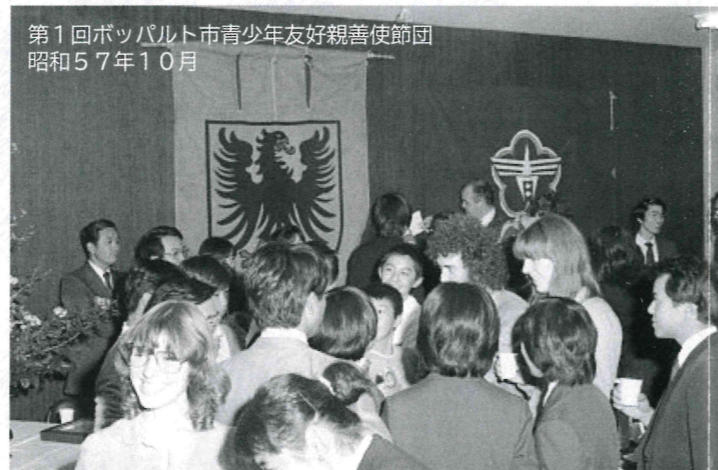
第1回ボツパルト市青少年友好親善使節団 昭和57年10月