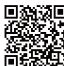
△申し込みフォーム