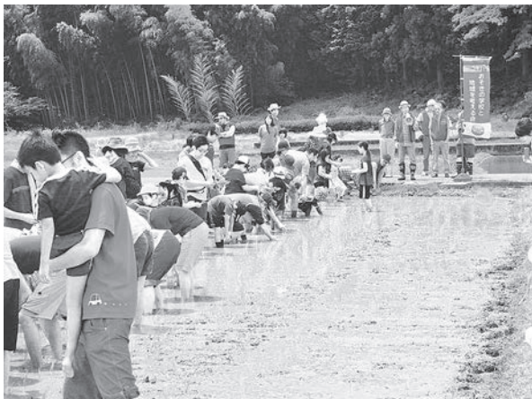
市民提案協働事業 (おそきDEブチ田舎暮らし～田植え体験～)

地域におけるあらゆる世代の多様な活動を広く支援するとともに、地域の声や地域特性を生かした、きめ細やかなサービスの充実に取り組みます。