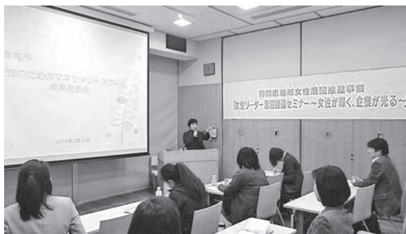
女性活躍推進事業