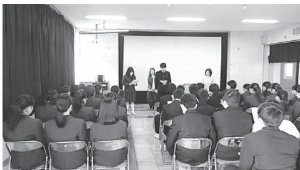
中学生向けデートDV講座

男女平等参画関連施策の推進に当たっては、青梅市男女平等推進計画懇談会において各事業の進捗管理、指標にもとづいた成果の把握や女性活躍推進にかかる取組に関する協議を行うなど、推進体制の充実を図ります。