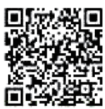
△ハザードマップめ組

たり、陥没または隆起した（図5） ▽地下水や井戸水等が濁った（図6） ▽池などの水量が急に変化した 災害発生時の情報提供 市では、市ホームページ、市メール配信サービス、防災行政無線で随時情報提供を行います。防災行政無線が聞き取れなかったときは電話応答☎0800・800・0062（無料）をご利用ください。また、避難行動に役立つ「ハザードマップめ組」（2次元コード参照）をご利用ください。 問い合わせ 防災課危機管理係