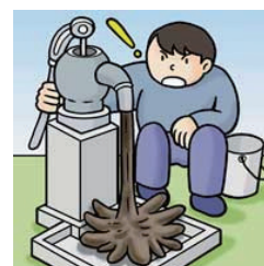
図6 井戸水等の濁り