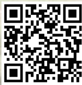
△新緑祭ホームページ