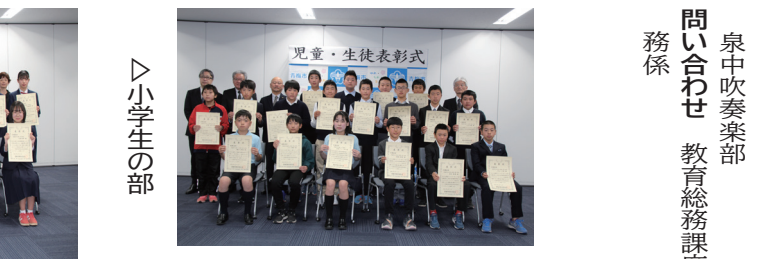
△小学生の部 △中学生の部