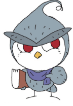
図書館妖怪♥さ〜のん