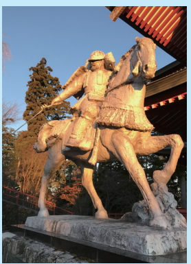
▷北村西望作・畠山重忠像

この像は昭和56(1981)年に執り行われた武蔵御嶽神社の式年大祭記念事業として彫刻家 北村西望により制作されました。