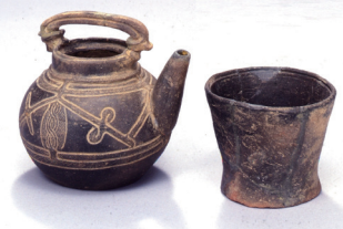
△注口土器と小型深鉢型土器