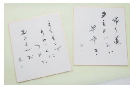
△審査員特別賞受賞句