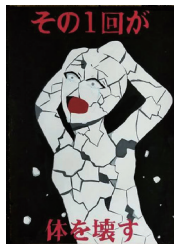
△ポスターの部 会長賞