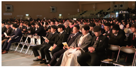
進学した方はいずれの部にも出席可 問い合わせ 社会教育課