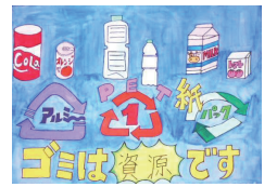
小学6年生の部金賞