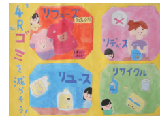
小学5年生の部金賞