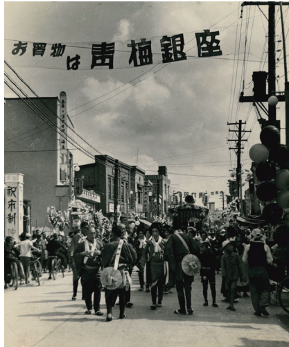
△市制を祝う人々(仲町付近)

7月3日～9月5日に郷土博物館で行っていた「ゆめうめちゃん」と行く時間旅行「青梅市誕生のひみつ」で展示していた、昭和26年の青梅市制施行祝賀式などの貴重な写真を、市役所1階で展示します。 展示期間 10月8日(金)～29日(金) ※土・日曜日を除く 問い合わせ 秘書広報課 書係