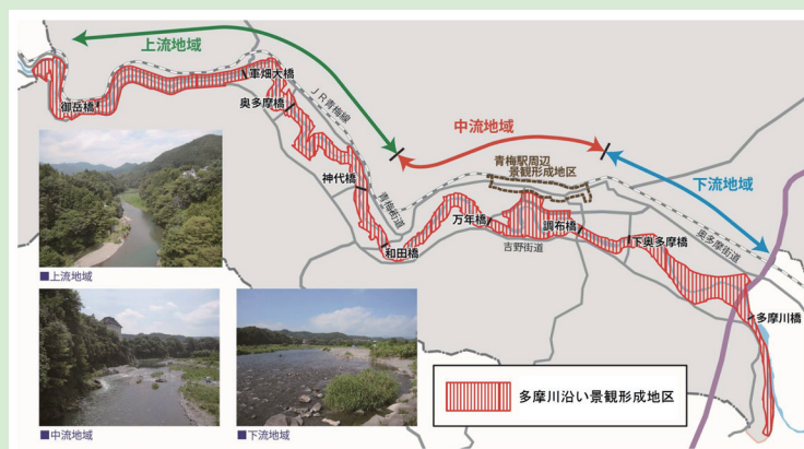
図2 多摩川沿い景観形成地区の範囲