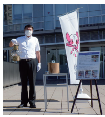
△採火した青梅の火

市内では、7月11日に公道(金剛寺)青梅市総合体育館、および特殊区間として御岳溪谷にてカヌーを使用した聖火リレーを予定していました。 しかし、新型コロナウイルスの感染状況から、東京都聖火リレー実行委員会の判断で公道等での聖火リレーが中止となり、代わりに瑞穂町の会場にて無観客による点火セレモニーが開催されました。 市内を走行予定であった26人のランナーが、トーチにともした聖火にそれぞれの思いを込めてつなぎました。