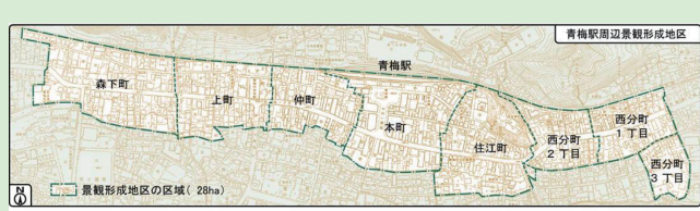
図1 青梅駅周辺景観形成地区の範囲

市では、「美しい風景都市・青梅」を目指し、優れた景観を持つまちづくりを進めるため、「青梅市の美しい風景を育む条例」に基づき、建築行為等について届け出を義務付けています。なお、重点的に景観形成を図る地区として指定している「青梅駅周辺景観形成地区」(図1)および「多摩川沿い景観形成地区」(図2)と、その他の「一般地区」では、届け出の対象が異なります。