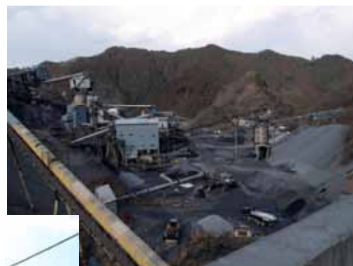
市内採石場の様子