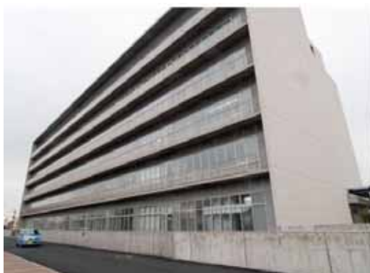
一般環境大気測定局（呼称：青梅）