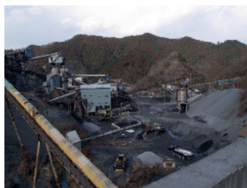
市内採石場の様子