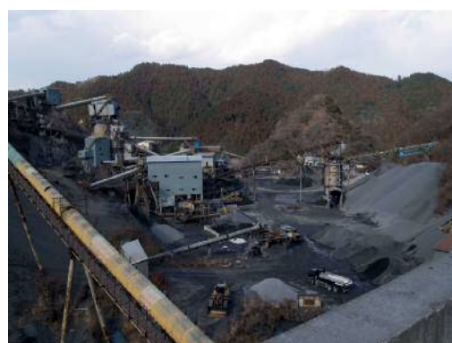
市内採石場の様子