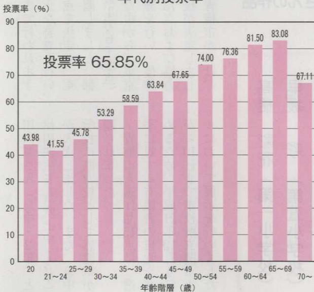
平成21年8月30日執行 衆議院議員選挙(小選挙区選出) 年代別投票率