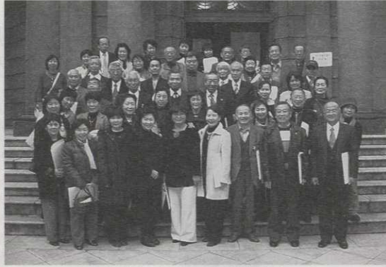
日本銀行本店 本館中庭にて

初めにNHK放送博物館を見学し、八四年の歴史に係るさまざまな展示物や資料から放送とは今も進歩を続け世の中を動かしているのを感じました。午後は貨幣博物館と日本銀行本店を見学。貨幣博物館は古代から現代に至るまでの日本貨幣史の資料や写真がわかりやすく展示されていました。最後に日本銀行本店を見学。本館は明治二九年に完成したバロック式の西洋建築物で、内館も荘厳な作りで圧倒されました。関東大震災にも壊れることなく、地下金庫は平成一六年まで一〇八年間使用されていたことに驚きました。昭和四九年に国の重要文化財に指定されているそ