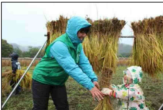
小雨になり、小さい子も楽しめました