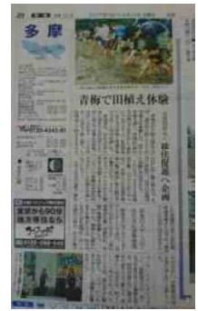
地元食材中心手作りカレーライスの昼食付 地域紹介、精米までの展示 & 瓶突き精米体験