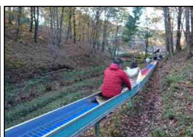
ローラーすべり台