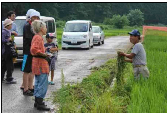
草の見分け方と取り方の指導