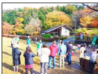
スタート・自己紹介