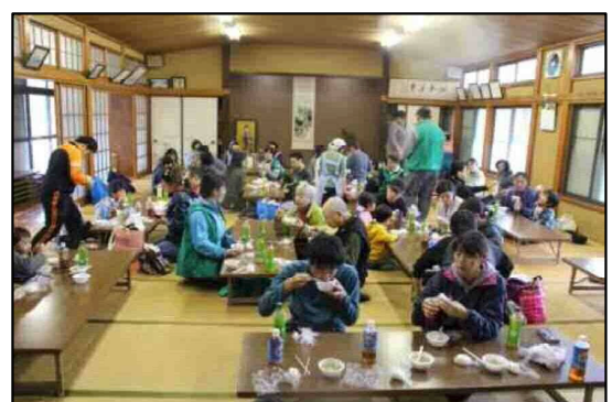
終了後は、自治会館にて地産品中心の昼食