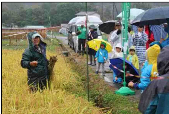
雨の為、参加者は大幅減少