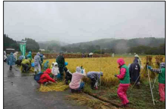
始める頃には小雨に