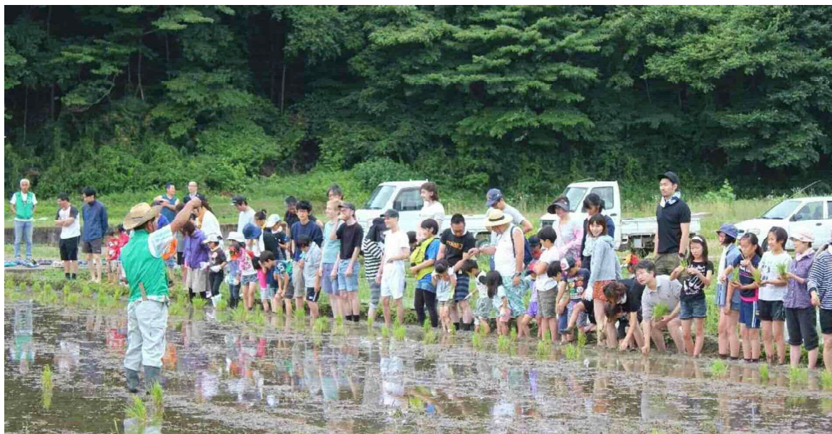
おそき DE プチ田舎暮らし 田植え体験 6月18日(日)