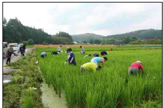
みんなで草取りなど田んぼの手入れを体験