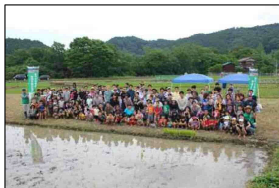
終了後にみんなで記念写真