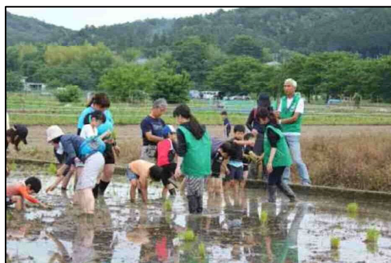
参加者もスタッフも年齢幅広く