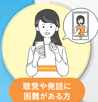
聴覚や発話に 困難がある方