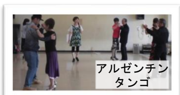
アルゼンチン タンゴ