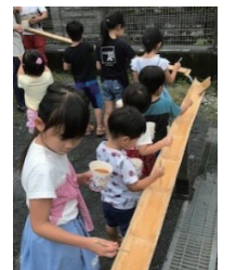
△流しそうめんの会

町内の子育て世代が主体となり実施している会に、自治会も積極的に参加して地域住民の交流の場となるようサポートをしています。