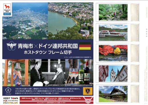
青梅市×ドイツ連邦共和国 ホストタウン フレーム切手