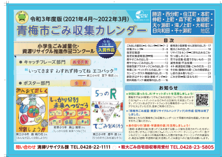
△青梅市ごみ収集カレンダー