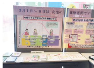
3月1日〜8日は女性の健康週間です。お問い合わせ 健康センター ☎23・2191