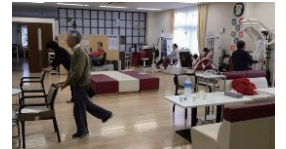
△いきいき健康クラブ

町内にあるデイサービスセンターのトレーニングマシンを借りて、自治会員の運動不足解消と健康維持促進のため、毎週日曜日にトレーニングを行っています。